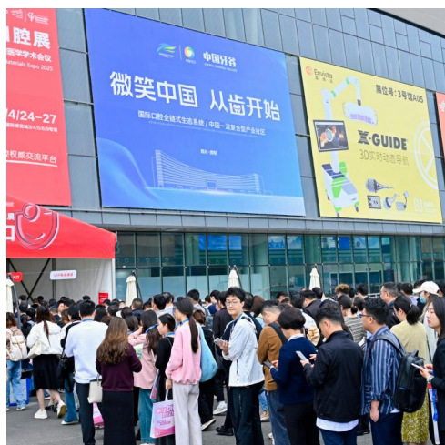
A-1 入口上方玻璃幕墙广告 ¥40,000/面