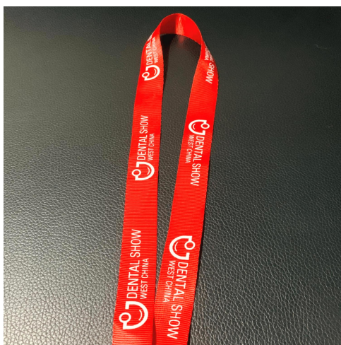
A-9 观众吊绳广告 ¥30,000/届