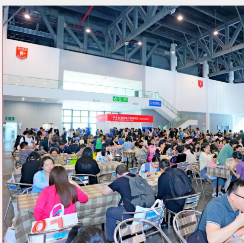
B-7 学术会代表餐饮区广告 ¥20,000/个