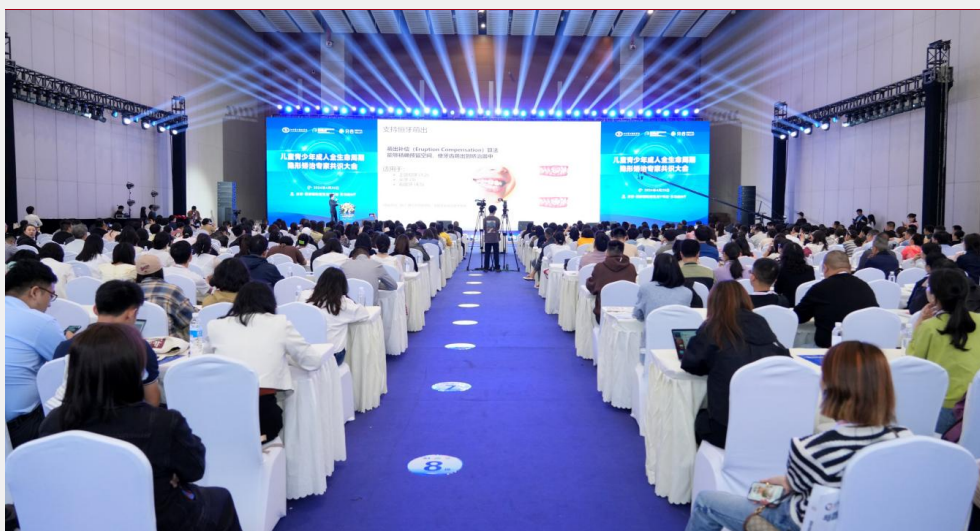
B-1 主题论坛赞助（费用商洽）