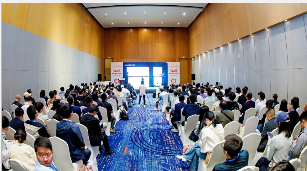
B-2 学术会/培训班专场赞助 ¥60,000/场