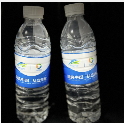
B-9 会议现场矿泉水广告 ¥20,000/届