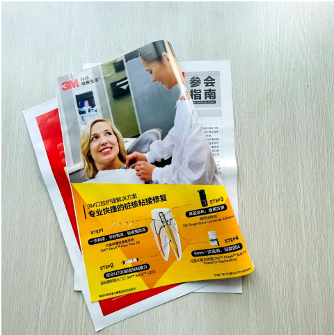
A-13 参会指南内页广告 ¥30,000/家