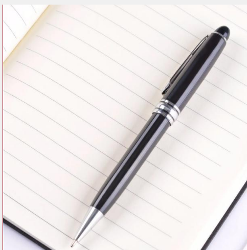
B-5 现场培训班学习用品赞助 ¥10,000/届