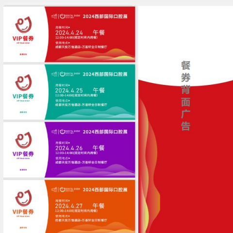
B-6 学术会VIP专家餐饮区广告 ¥30,000/届