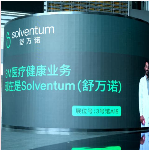
A-17 中央大厅曲面LED广告 ¥30,000/家