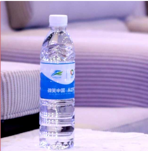
A-15 展商用矿泉水广告 ¥20,000/届