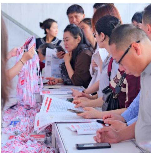
A-8 观众胸卡背面广告 ¥30,000/届