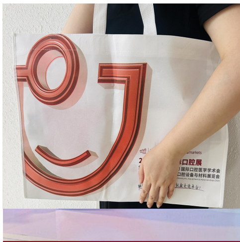
A-11 手提袋插入广告 ¥20,000/家