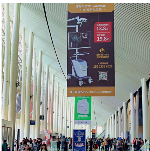
A-6 大厅廊檐吊旗广告 ¥18,000/面