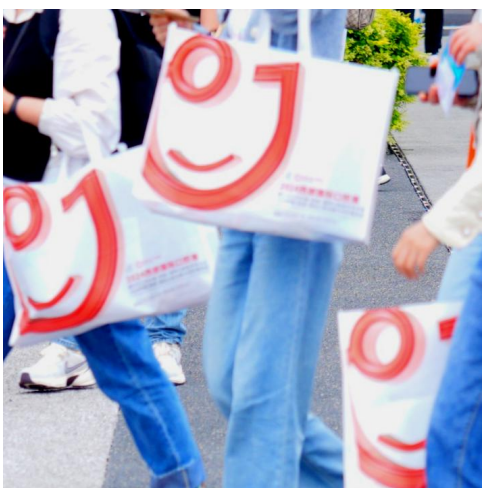
A-10 手提袋袋面广告 ¥25,000/家