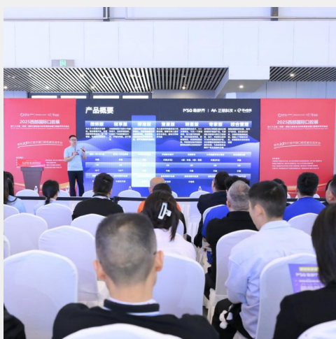
B-4 企业新品发布会 ¥3,000/0.5H