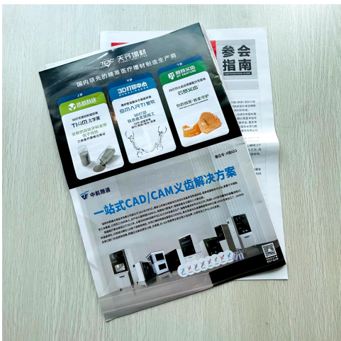
A-14 参会指南内页1/2广告 ¥15,000/家