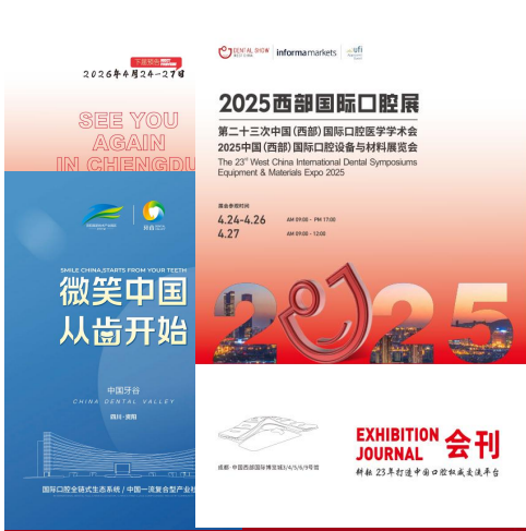
A-12 会刊内页广告 ¥10,000/页