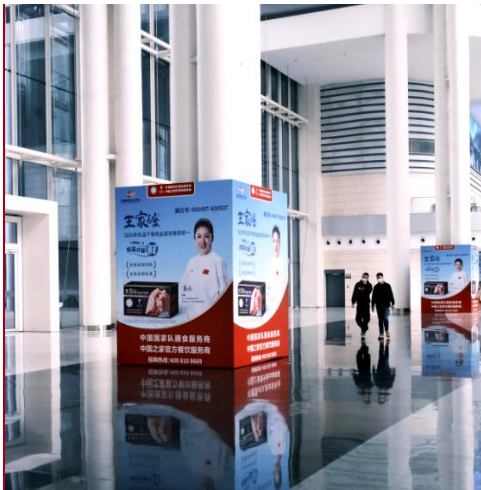
A-16 大厅檐廊包柱广告 ¥15,000 /个