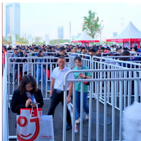
A-5 观众入口围栏广告 ¥8,000/6面