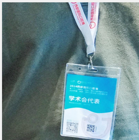
B-8 会议代表胸卡背面广告 ¥20,000/届