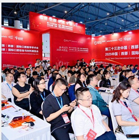
B-3 品牌口腔学术专场 ¥15,000/3H