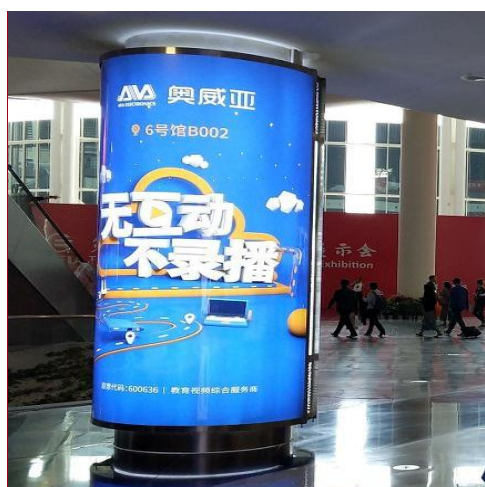
A-3 学术会入口圆柱灯箱广告 ¥5,000/面