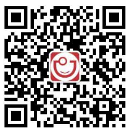
西部国际口腔展（订阅号）

请提前将展位预订信息（公司名称+预订面积+联系人电话）发送短信至15902882580或关注西部国际口腔展官方微信（wcise028），点击菜单栏“展商中心”-“展位预订”。