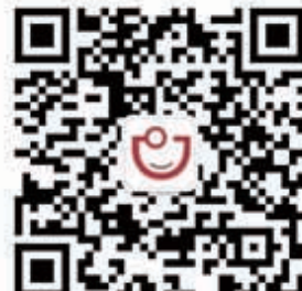
西部国际口腔展（服务号）