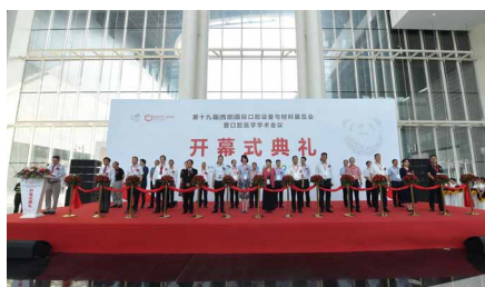
▶ 2020年西部国际口腔展开幕式