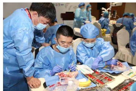
▶ 11个“手把手”口腔新技术实操培训班