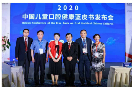
▶ 《中国儿童口腔健康状况蓝皮书》发布会