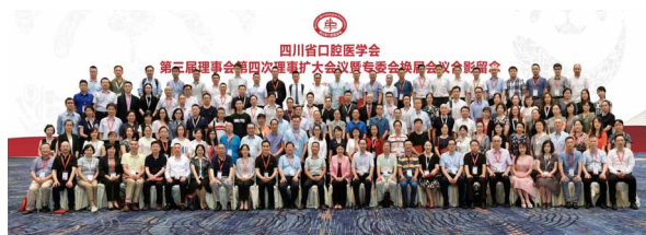
▶ 四川省口腔医学会第三届理事会第四次理事扩大会议暨专委会换届会议