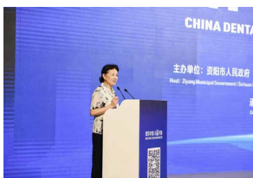
▶ 中国牙谷国际峰会