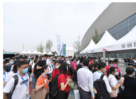
▶ 来自全国各地的热情观众