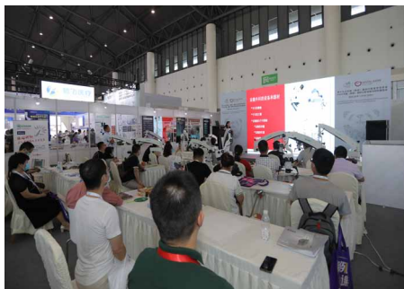
▶ 国际口腔显微技术大会